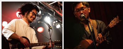
キンシコウカズヤ